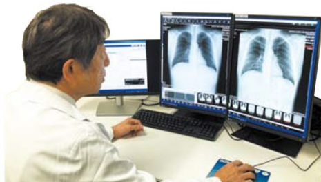
（胸部X線読影支援システム）

安心して検査を受けていただくため、検査技術や検査機器、読影体制の精度管理の徹底を行っており、各種認定技師、専門医をはじめ施設認定や指導施設等の認定を受けています。